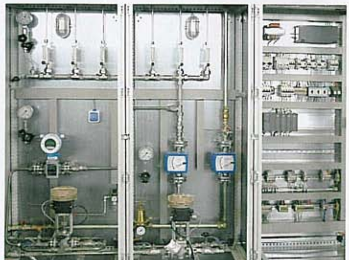
Mess- und Regeltechnik einer SNCR-Anlage